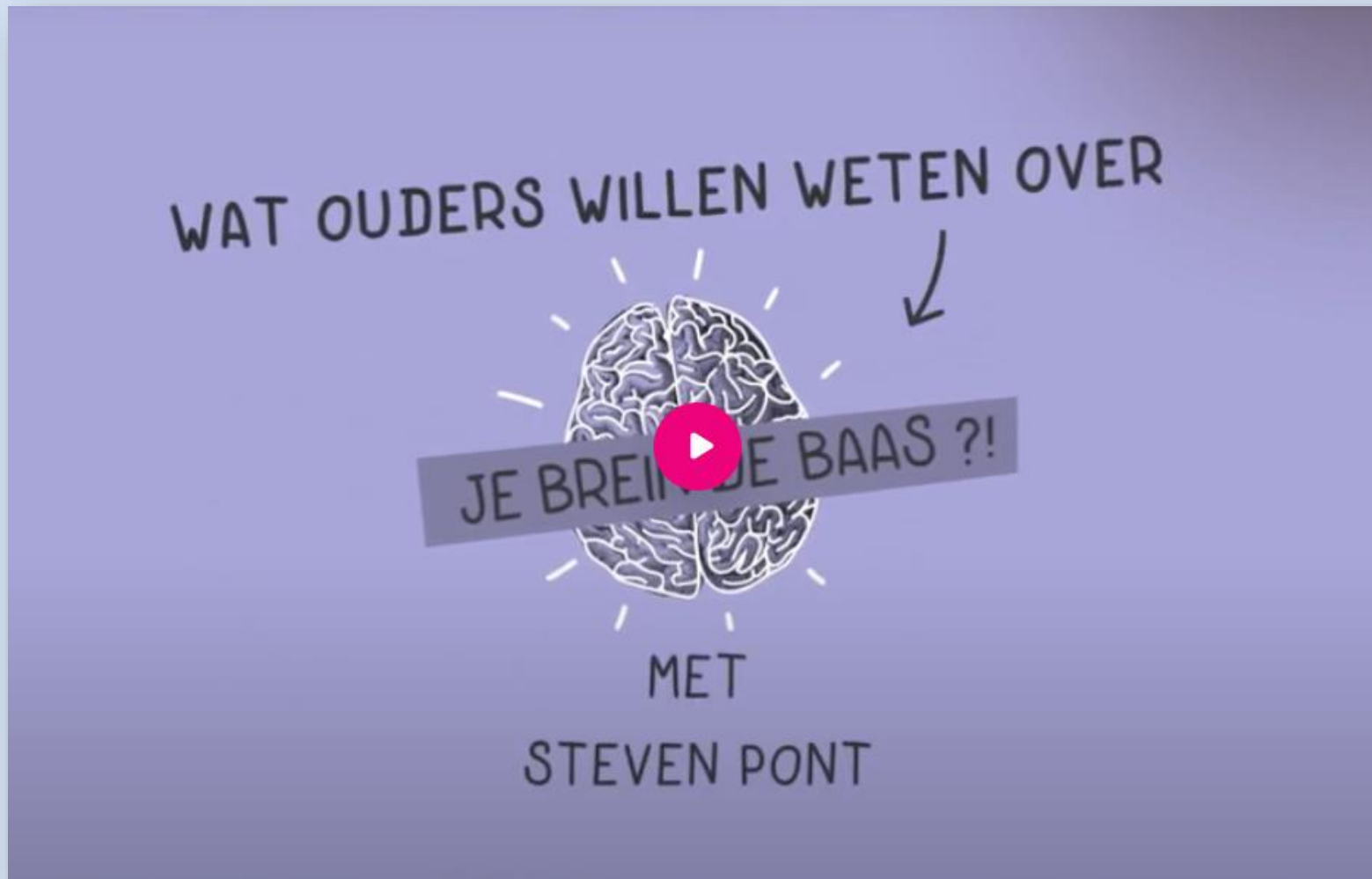
Je Brein de Baas?! - Film voor ouders