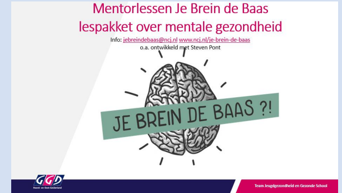
Vervolg door mentor