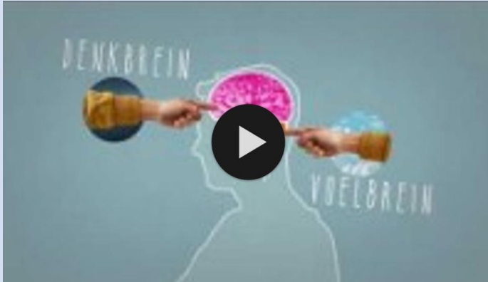
Filmpje over stress